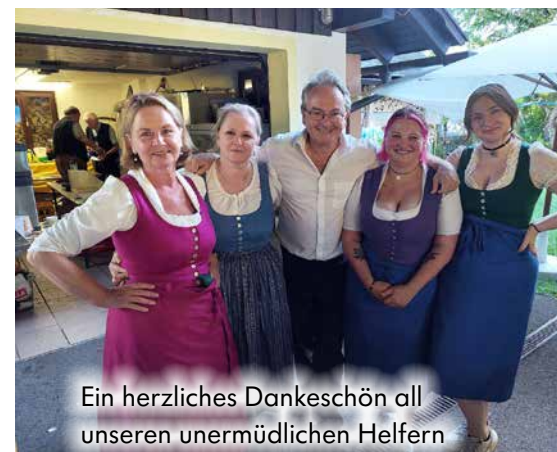
Ein herzliches Dankeschön all unseren unermüdlichen Helfern